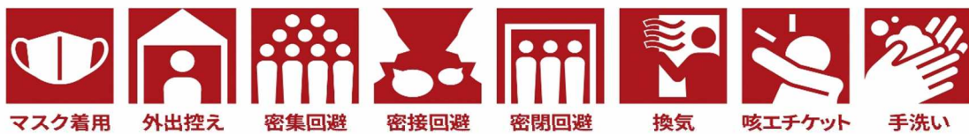
マスク着用 外出控え 密集回避 密接回避 密閉回避 換気 咳エチケット 手洗い