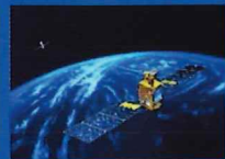
光衛星間通信 実験衛星 きらり(OICETS)