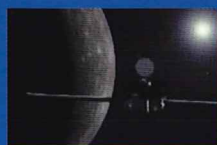
水星磁気圏探査機 みお(MMO)