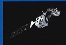
地球観測衛星 Earth Care