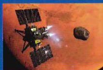
火星衛星探査計画 (MMX)探査機