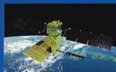
先進レーダ衛星 「だいち4号」 (ALOS-4)