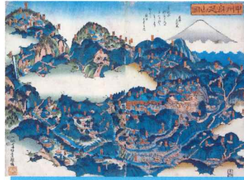
甲州身延山図(山梨県立博物館蔵) ※展示期間:7/18~8/16