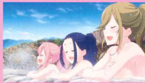
『ゆるキャン△』第5話 「二つのキャンプ、二人の景色」