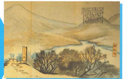
国立公園富士五湖勝地漫画 (山梨県立博物館蔵)