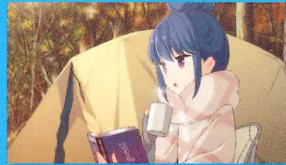
『ゆるキャン△』第1話 「ふじさんとカレーめん」