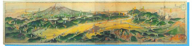
甲府盆地鳥瞰図 (山梨県立博物館蔵)