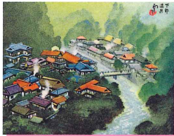
温泉郷の風光(個人蔵)