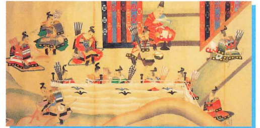
後三年合戦絵巻 模本(山梨県立博物館蔵)